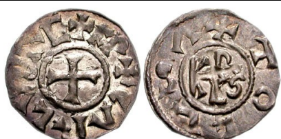
Denier de Charlemagne

Charlemagne ne sait pas lire, mais il désire que les fonctionnaires sachent lire et écrire. Il encourage le développement des arts et du savoir . Il a ouvert une école dans son palais et a demandé que des écoles soient ouvertes dans chaque évêché et chaque monastère.